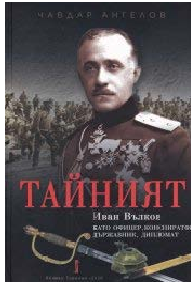
Корица на монографията „Тайният“: Иван Вълков като офицер, конспиратор, държавник, дипломат“ от Чавдар Ангелов [1]

Монографията е първото сериозно научно изследване за живота и дейността на ген. Иван Вълков. Монографията разкрива малко познати факти от живота на генерала. Думата „Тайният“ в заглавието е името на досието с активната разработка за Иван Вълков от агентите на Държавна сигурност (ДС), наречен така заради изключителната му дискретност.