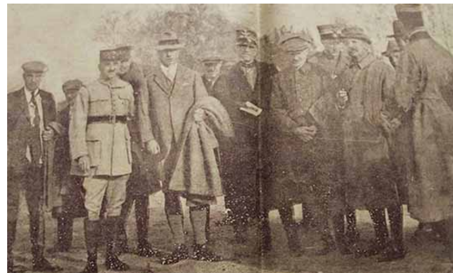
Членовете на международната анкета от Обществото на народите в България, които на място проучват изстъпленията на гръцките войски

През октомври 1925 г., при нахлуването на гръцките войски в района на Петрич (т.нар. “Петрички инцидент”), ген. Вълков, като министър на войната, предприема не военни, а дипломатически действия за възстановяване на статуквото [1,7,9]. Той издава заповед да не се отговаря на гръцкия огън и сезира Съвета на тогавашната Организация на народите с искане за бърза намеса с цел спиране на гръцката агресия. В резултат Гърция е призната за виновна и е задължена да се изтегли незабавно, като заплати обезщетение на България за жертвите и нанесените разрушения. Това е един от безспорните успехи на българската дипломация в най-новата ни история.